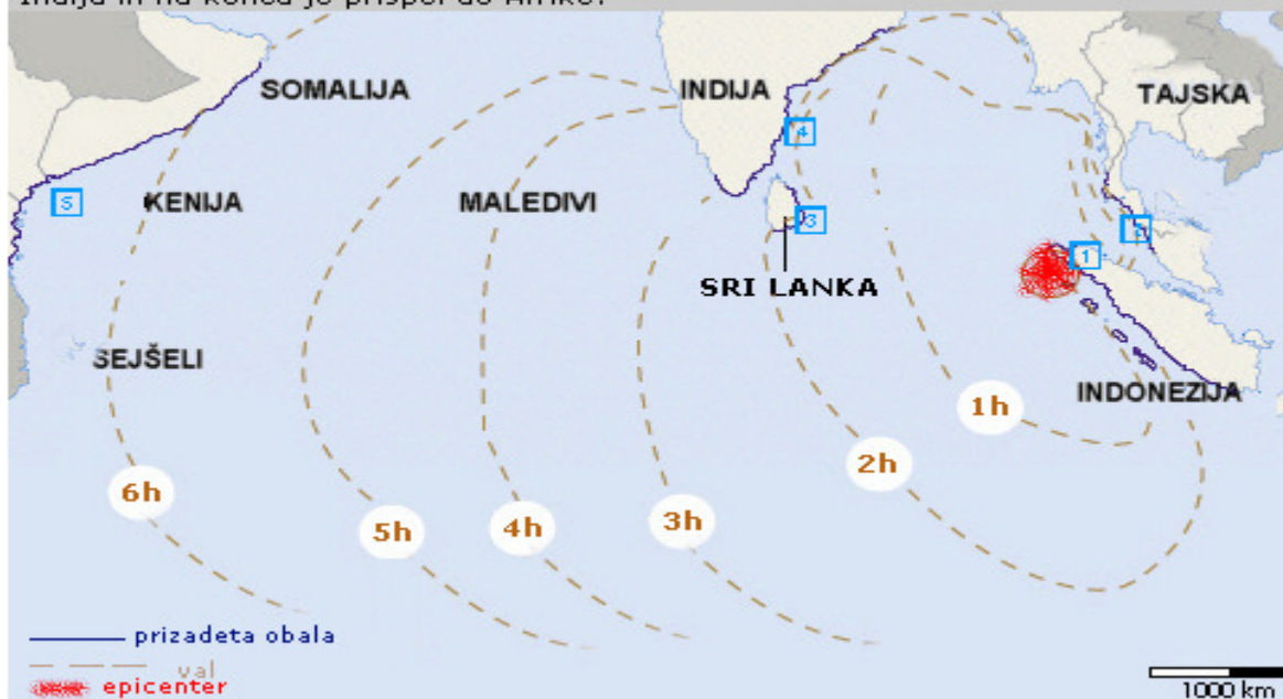
Slika 3: Širjenje vala

Karta prikazuje prizadeto območje in kako se je širil val po potresu v morju ob 7h59 krajevnem času. Najprej indonezijski otok Sumatra, nato Tajska, Sri Lanka, Indija in na koncu je prispel do Afrike.